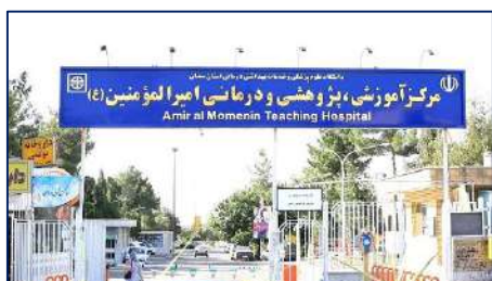
نجات جان مادر باردار پرخطر با جفت پره کرتا در بیمارستان امیرالمومنین (ع) ۱۴۰۱/۰۹/۰۷