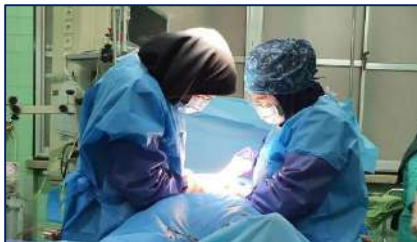
نجات جان مادر ۲۷ ساله با اقدام فوری و تلاش پزشکان متخصص و کادر درمان بیمارستان معتمدی ۱۴۰۱/۰۹/۲۳