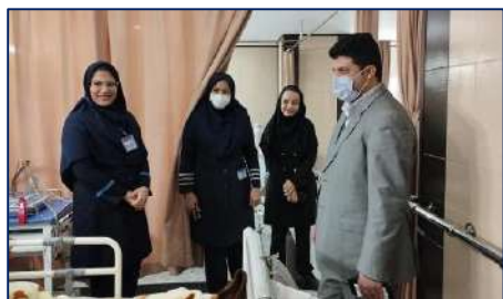
بازدید سرپرست فرماندار گرمسار از بیمارستان معتمدی به مناسبت هفته پرستار ۱۴۰۱/۰۹/۰۹