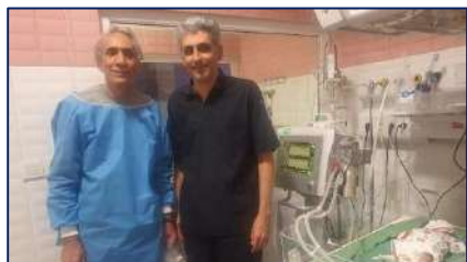
درمان رتینوپاتی نوزاد نارس برای اولین بار در دانشگاه علوم پزشکی استان سمنان ۱۴۰۱/۰۹/۱۲