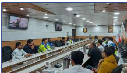
کارگاه اورژانس هوایی برای کارکنان عملیاتی فوریت های پزشکی دانشگاه برگزار شد ۱۴۰۱/۰۹/۲۳