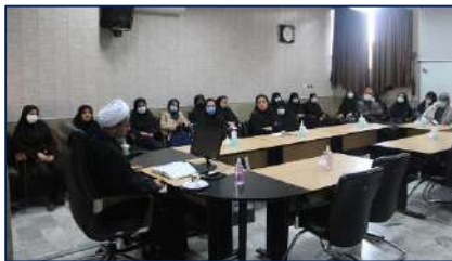
سخنرانی امام جمعه دامغان به مناسبت ایام فاطمیه در شبکه بهداشت و درمان دامغان ۱۴۰۱/۰۹/۱۹