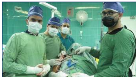
انجام عمل موفقیت آمیز جراحی مفصل شانه به روش بنکارت برای اولین بار در بیمارستان کوثر ۱۴۰۱/۰۹/۰۵