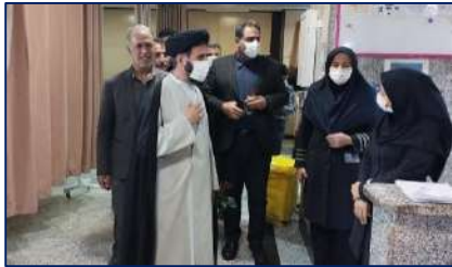
دیدار امام جمعه گرمسار و جمعی از مسئولین شهری به مناسبت روز پرستار ۱۴۰۱/۰۹/۱۲